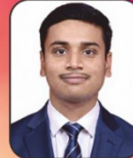
Gogate P.S. Asst. Professor